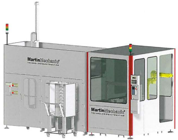
MRC 241110 RoboCube mit Palettenprofil

tieren verschiedene Ansätze und prüfen, welche Lösung optimal ist. Danach fixieren wir diese in einem detaillierten Angebot.