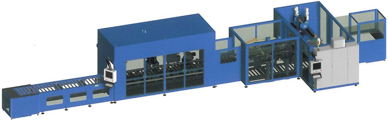
MFL 22940 Fading-Line: Fertigungsanlage um Teile einer Reihe von Prozessen zum Oberflächen-Finish zu unterziehen.